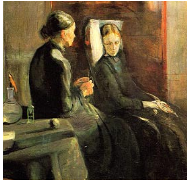
In dieser Darstellung einer Mutter und ihres sterbenden Kindes („Frühling“, 1889) verarbeitete Munch seine eigenen Erlebnisse. (Nationalgalerie, Oslo).

Die Pest- und Tuberkuloseepidemien hinterließen auf Generationen hinaus einen tiefen Eindruck und hatten insbesondere auf die Kunst ihrer Zeit unübersehbare Auswirkungen. Zwischen Kunst und Infektionskrankheiten besteht aber noch eine viel tiefere Verbindung. Die Kunst zeigt, wie man Krankheiten in früheren Zeiten behandelte. Sie macht kritische Aussagen. Sie wurde genutzt, um die Öffentlichkeit zu informieren und Vorbeugungsmaßnahmen zu fördern. Trotz aller unserer Bemühungen deutet nichts darauf hin, dass Infektionskrankheiten die Menschheit in Frieden lassen würden, und die Kunst wird auch weiterhin unserem Leiden Ausdruck verleihen, aber auch unserer Hartnäckigkeit im Kampf gegen unsere uralten Feinde.