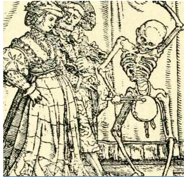
Der deutsche Künstler Hans Holbein schuf zwischen 1523 und 1526 eine berühmte Serie von Holzschnitten mit Darstellungen des Totentanzes.

Die Pest hatte eine eindeutige Erkenntnis gebracht: Der Tod kennt keine Vorurteile. Und an die Stelle des Entsetzens, das die Pest und ihre verheerenden Folgen anfangs begleitet hatte, war anscheinend die nüchterne Einsicht getreten, dass der Tod unvermeidlich ist. Irgendwann verlor die Beulenpest in Europa zwar an Boden, das Thema des Toten-