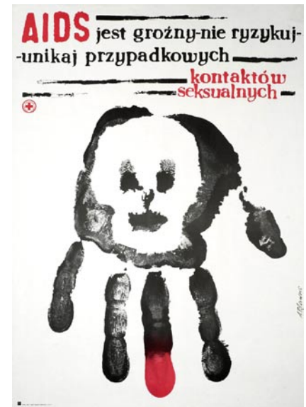
Art has been an important tool worldwide in campaigns for AIDS education and prevention. (Andrzej Pagowski - National Library of Medicine)