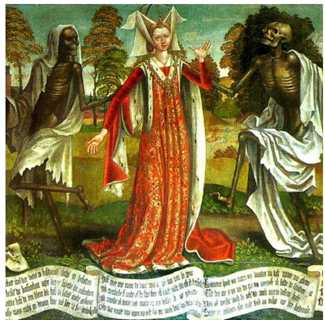
„Totentanz“, Gemälde von Bernt Notke, gemalt in der Nikolaikirche in Tallinn (Estland) gegen Ende des 15. Jahrhunderts. Das Bild war insgesamt vermutlich 30 Meter lang. Heute sind noch rund 25 Prozent erhalten.