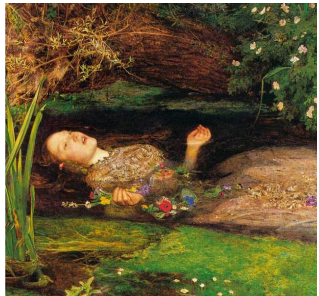
Elizabeth Siddal, Modell mehrerer Präraffaeliten (hier in „Ophelia“ von Millais, 1852), dürfte Tuberkulose gehabt haben. (Tate Gallery, London).

Viele Dichter und Schriftsteller, unter ihnen auch Keats selbst, waren mit der Krankheit infiziert. Man glaubte, der Körper schwinde langsam dahin, und die „Schwindsucht“ wurde zur Anregung für den Geist. Alexandre Dumas schrieb in seinen Memoiren: „Es war Mode, an der Lunge zu leiden; alle, insbesondere aber die Dichter, waren schwindsüchtig; es gehörte zum guten Ton, nach jeder Empfindung, die nur im geringsten sinnlich war, Blut zu spucken und mit noch nicht einmal 30 Jahren zu sterben.“ Auch in der Dichtung war die Tuberkulose ein weit verbreitetes Thema - schwindsüchtige, blasse Heldinnen, die in jungen Jahren starben, und empfindsame Kinder, die aus dem Dasein dahinschwanden. Thomas Mann ließ sich von einem